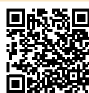
Hier gelangen Sie direkt zur Seite des Innenministeriums