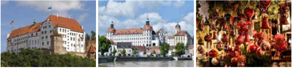
Die Burg Trausitz in Landshut, Herzogsschloss und Weihnachtsmarkt in Neuburg a.d. Donau (v.l.n.r.)

Kapellenraum. Wir beenden die Führung in der rustikalen Bauernstube bei Getränken und einem original Osterwinder Butterbrot. Rückfahrt nach Landshut und Besuch des traditionellen Landshuter Christkindlmarktes und Krippenweges.